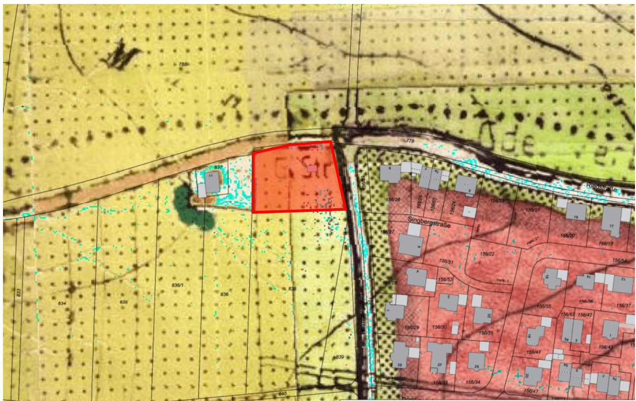
Abbildung 1: Ausschnitt aus dem Flächennutzungsplan der Gemeinde Steinach – ohne Maßstab

Mit Bescheid der Regierung von Niederbayern vom 13.05.1986 (Nr. 420-4621/933) und vom 09.06.1986 (Nr. 420-4621/955) wurde für die Gemeinde Steinach ein Flächennutzungsplan genehmigt. Darin ist das geplante Gebiet als Fläche für die Landwirtschaft dargestellt.