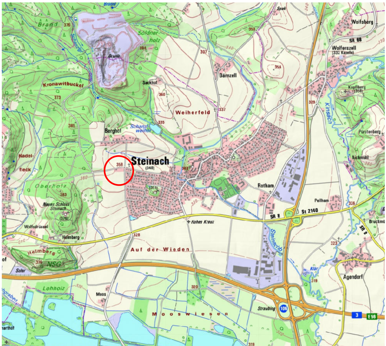
Abb. 1: Übersichtslageplan aus dem BayernAtlas vom 21.07.2025 – Maßstab 1:25.000