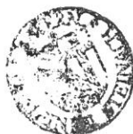
Mühlbauer 1. Bürgermeister